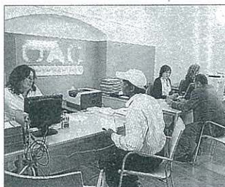
Oficina del OAC en el Ajuntament de Ciutadella.