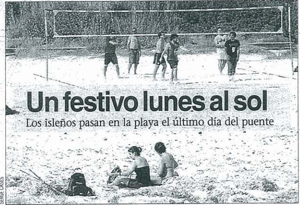
Un festivo lunes al sol Los isleños pasan en la playa el último día del puente

digital www.ultimahora.es/menorca Edición