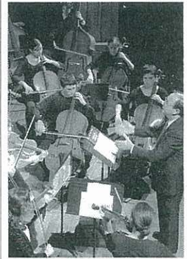
MENORCA, MÚSICA Y TEATRO